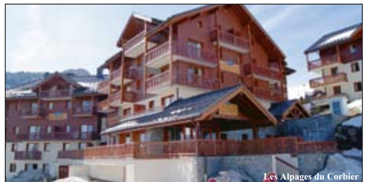
Les Alpapes du Corbier

Auf einem sonnigen Hochplateau 1800 m über dem Meeresspiegel gelegen, bietet La Toussuire den Zugang zu einem der größten Skigebiete Frankreichs. Der Wintersportort selbst beschreibt sich als authentisches Bergdorf, dessen Einwohner Ihre Gäste aufrichtig und herzlich willkommen heißen. Neben den typischen Wohnblocks finden sich hier tatsächlich noch viele Holzchalets und alte Bauernhöfe.