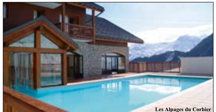
Les Alpapes du Corbier