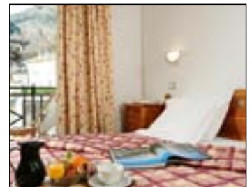
** Hotel La Vanoise