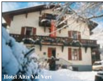
Hotel Altis Val Vert