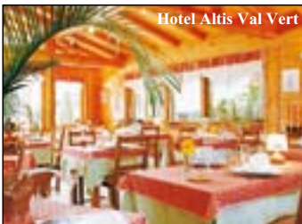
Hotel Altis Val Vert