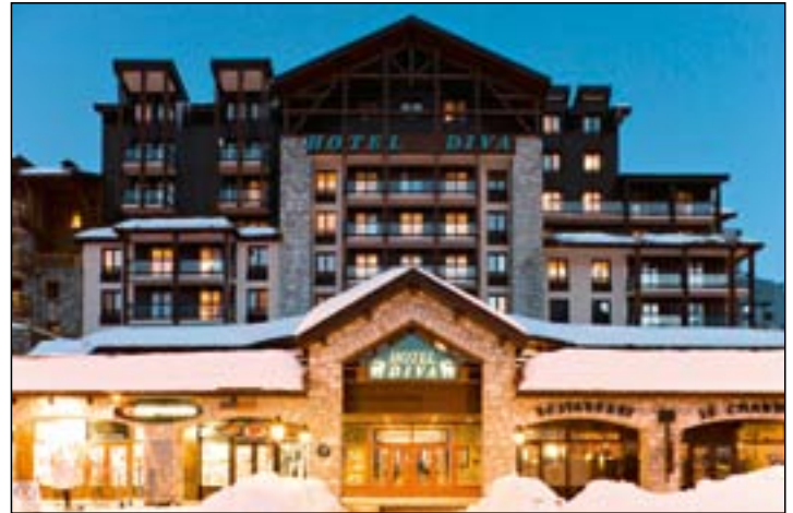
*** Hotel Diva / Val Claret

Dies sind Musterbeschreibungen. Die Ausstattungen der Wohnungen können geringfügig variieren.