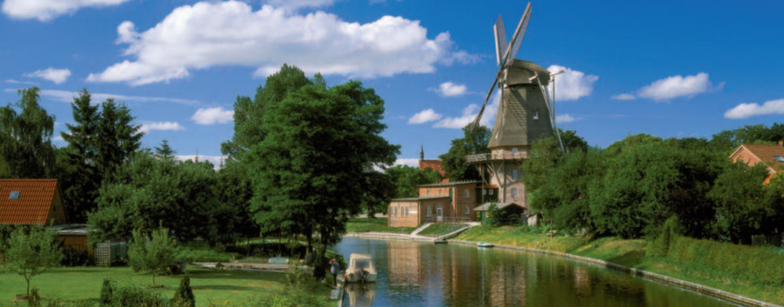
Windmühle am Kanal