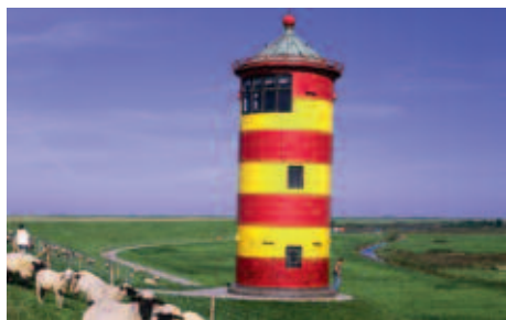
Deichlandschaft mit Leuchtturm

Eine herrliche Landschaft, interessante Ausflüge, das gesunde Klima und eine Hoteliersfamilie, die stets um Ihr Wohl besorgt ist, dürfen Sie auf dieser Reise in die nordwestlichste Region Deutschlands erwarten! Kommen Sie mit auf Klönschnak, Kluntjes, Tee und mehr!