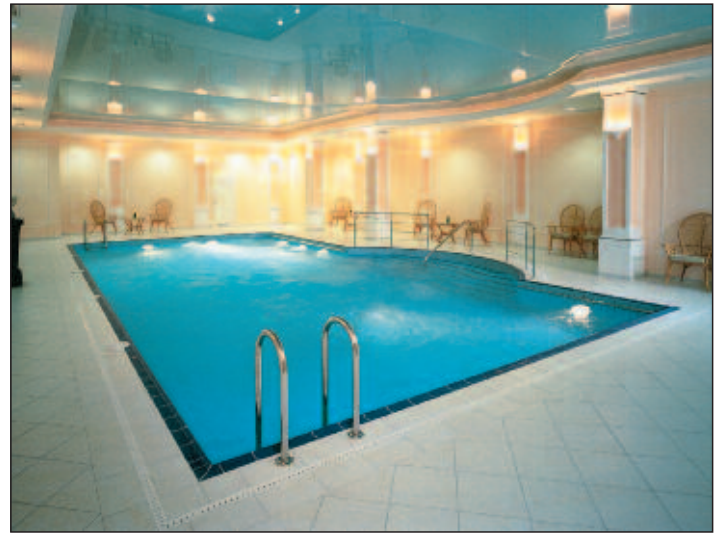
Hotel Richmond – Schwimmbad