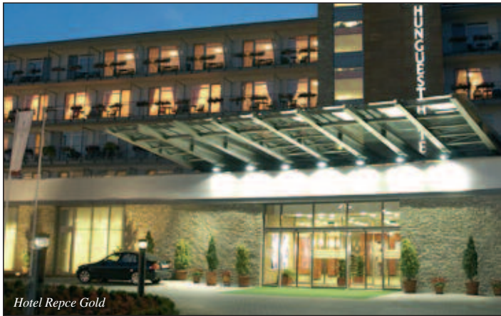
Hotel Répce Gold